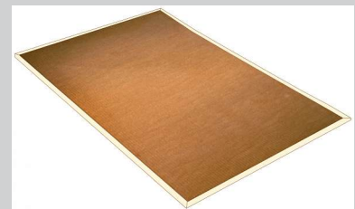
Trockenestrich/Schalldämmplatte PhoneStar ST