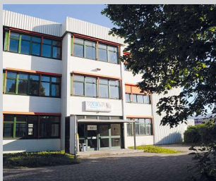
Firmensitz in D-91560 Heilsbronn bei Nürnberg