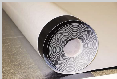
FLAGON Premio stick