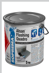
ALSAN Flashing quadro

Für Dächer von heute und morgen: Neue Universalabdichtungsbahn SOPRALENE UNI+