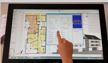
CAD am Touchmonitor

Viele Interessenten, die CADDER anschauen, wagen auch den Innovationssprung!