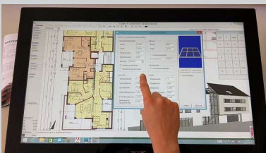
CAD am Touchmonitor

Viele Interessenten, die CADDER anschauen, wagen auch den Innovationssprung!