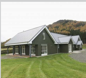
Ein einzigartiges Ferienhaus in Schottland