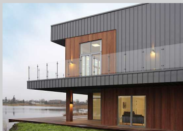
TV2 NORD - Stilistische Architektur am See